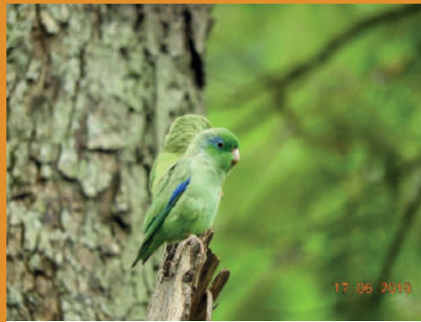
Forpus conspicillatus - Perico cascabelito

Respecto a la fauna silvestre rescatada y reubicada, se reporta un total de 27 individuos rescatados, de los cuales el grupo más representativo fue la clase Anfibios con 13 individuos, seguido de Reptiles con 12 y 2 mamíferos.