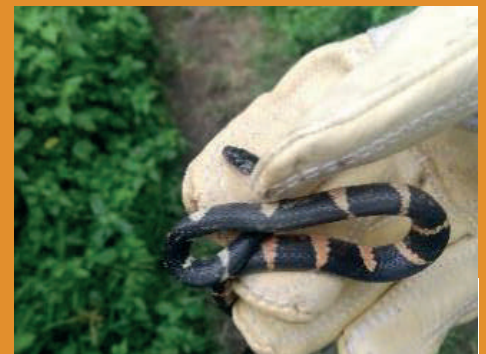
Pliocercus euryzonus - Falsa Coral