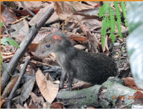
Dasyprocta punctata - Ñeque o Guatín

• Durante el año 2019, en los tramos de ejecución de la casa constructora Consorcio UNICA ubicada en la UF1 (Cañasgordas – Uramita), encontró un total de 614 individuos de fauna silvestre, de los cuales la clase de aves fue la que presentó mayor abundancia con 576 individuos avistados, seguido de los reptiles con 15, anfibios 13 y mamíferos 10.