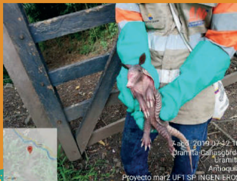
Dasyplus novemcinctus - Armadillo de siete bandas

• Durante el año 2019 en los tramos de ejecución de la casa constructora SP Ingenieros ubicada en la UF1 (Cañasgordas), se realizó la reubicación de 10 individuos de fauna silvestre, en su mayoría reptiles, la reubicación de dichos individuos se realizó en zonas con coberturas vegetales boscosas que estuvieran por fuera de las áreas de intervención al proyecto.