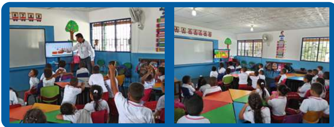
Socialización PMT y entrega de donación

Esta jornada además de la socialización, estuvo acompañada de una donación por parte del constructor CHEC, del Proyecto Autopista al Mar 2, de un Video Beam y telón blanco para su proyección.