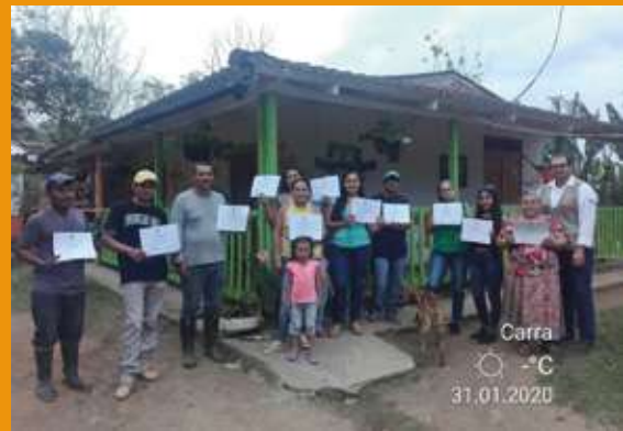
Manifiestan asociados de la iniciativa productiva