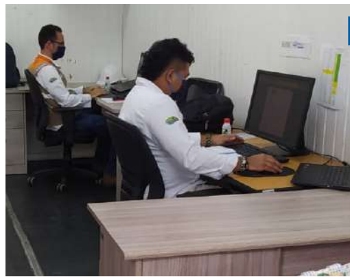
Los espacios de trabajo son amplios, conservando el distanciamiento y utilizando siempre tapabocas.