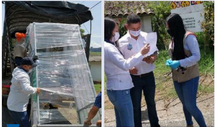
Donación de cabinas de aspersión a las alcaldías de Cañasgordas y Frontino, por parte de nuestro Consorcio UNICA.

El Consorcio UNICA, pensando en la necesidad de aportar a mejorar las condiciones de las instituciones prestadoras de salud que se encuentran cercanas a los frentes de obra, realizó la donación de 2 cabinas de desinfección para el personal de salud, con el fin de evitar el contagio por COVID_19, cuya función es atacar las partículas del virus lo que mitiga el riesgo de contagio. Las cabinas fueron entregadas a las alcaldías de Cañasgordas y Frontino; quienes se encargaron de llevarlas a los centros de salud.