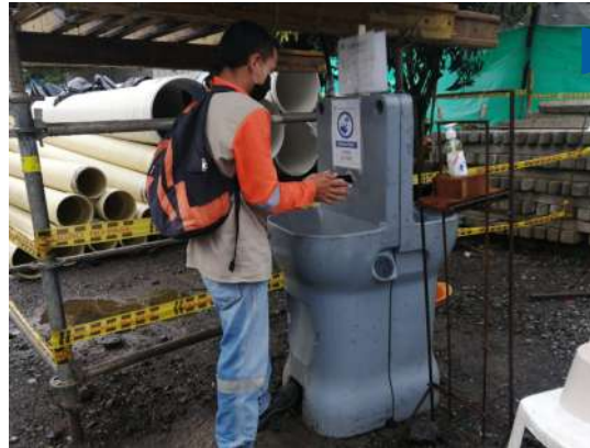
Puntos de desinfección: cada uno de los contenedores cuenta con alcohol y gel antibacterial para la utilización de cada persona que ingresa.

Al llegar, se toma la temperatura y registra la hora de ingreso y salida, indicando cuál fue la temperatura.