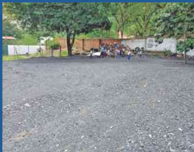
Terreno nivelado con el material dispuesto