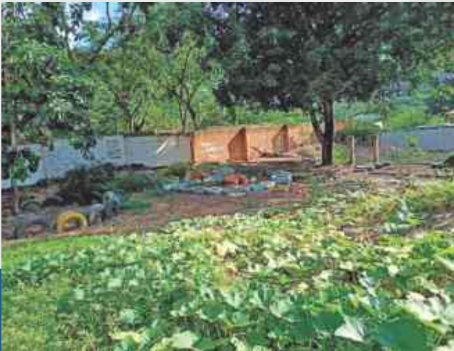
Terreno de la Institución Educativa Madre Laura Montoya, el cual se solicitó nivelar