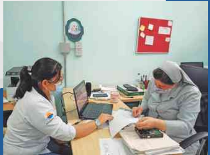
Terreno de la Institución Educativa Madre Laura Montoya, el cual se solicitó nivelar