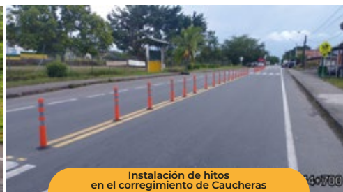
Instalación de hitos en el corregimiento de Caucheras