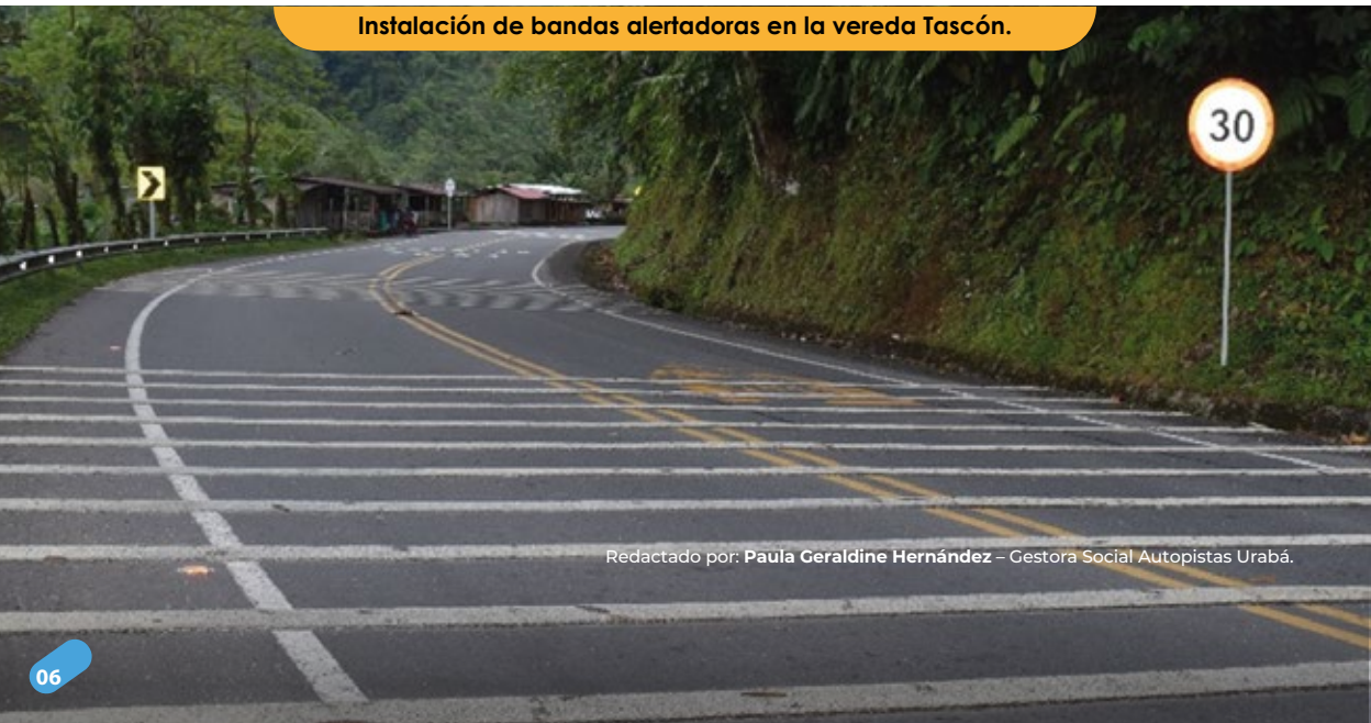
Instalación de bandas alertadoras en la vereda Tascón.

Redactado por: Paula Geraldine Hernández – Gestora Social Autopistas Urabá.