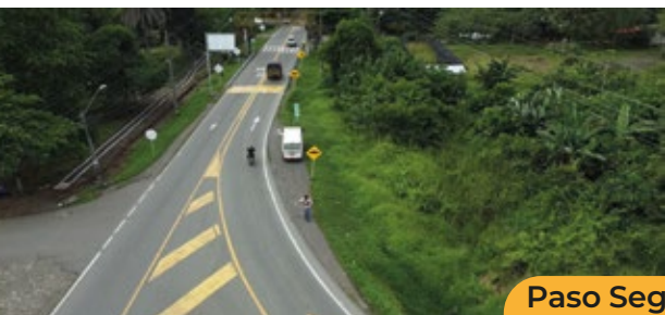
Paso Seguro Zungo

Por ello hemos realizado diferentes acciones en el marco de la Seguridad Vial, para generar comportamientos seguros, entre ellas están: