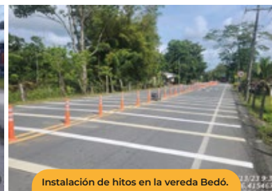
Instalación de hitos en la vereda Bedó.