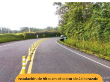
Instalación de hitos en el sector de Jaikerazabi