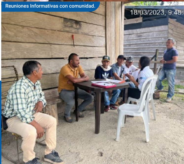
Reuniones Informativas con comunidad.

3/15/23, 3:48 p.m. Carrera 10-8-100-3-26 Mutatá Antioquia Colombia