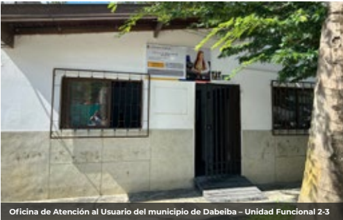
Oficina de Atención al Usuario del municipio de Dabeiba - Unidad Funcional 2-3

La nueva ubicación es la carrera 11 N° 11-43 en el barrio centro de la cabecera municipal de Dabeiba, en este nuevo espacio se continuará brindando información de interés relacionada al proyecto Autopista al Mar 2 y orientación al usuario, así como, la gestión de peticiones, quejas, reclamos y sugerencias que presente la comunidad.