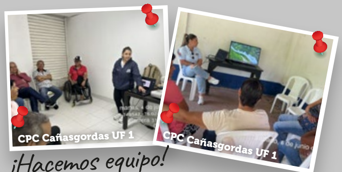
CPC Cañasgordas UF 1

En estos espacios de seguimiento a los comités, se enfatizó la importancia de su rol durante la ejecución del proyecto "Autopista al Mar 2". Además, se les brindó capacitación sobre los "Mecanismos de Participación Ciudadana para el Control Social".