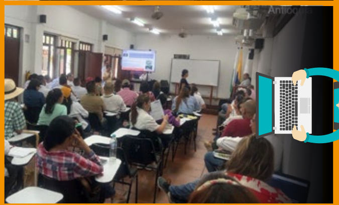
Mesas Técnicas en el municipio de Santa Fe de Antioquia