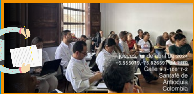
Mesas Técnicas en el municipio de Santa Fe de Antioquia

Estas mesas han contado con la participación de la Concesión Autopistas Urabá S.A.S., así como de diversas instituciones, entre las cuales se incluyen la Agencia Nacional de Infraestructura (ANI), la Autoridad de Licencias Ambientales (ANLA), el Instituto Nacional de Vías (INVIAS), la Gobernación de Antioquia, la Administración Municipal de Santa Fe de Antioquia, DEVIMAR, y comunidades de los municipios de Dabeiba, Cañasgordas, Giraldo, Sopetrán, Santa Fe de Antioquia, San Cristóbal y Palmitas.