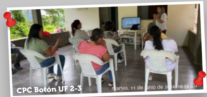
CPC Botón UF 2-3

En cumplimiento de las Licencias Ambientales y de lo establecido en el Apéndice Técnico 8 SOCIAL - del Contrato de Concesión bajo el esquema de APP N°18 del 25 de noviembre de 2015, hemos llevado a cabo encuentros con los comités de participación ciudadana de Cañasgordas y Uramita, que pertenecen a la Unidad Funcional 1, así como con el comité de la vereda Botón, que forma parte de la Unidad Funcional 2-3 de nuestro corredor vial.