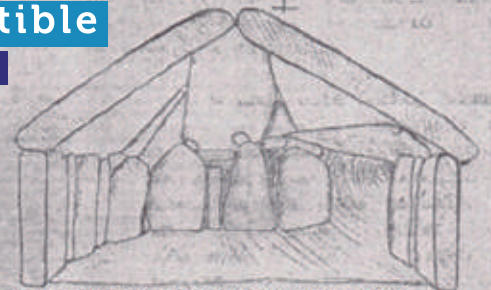
Figura 2. Dibujo estructura funeraria de Cañasgordas (Botero, 2000).

Bosquejo, corte en perspectiva, obsérvese la profundidad a la que se encuentra la estructura